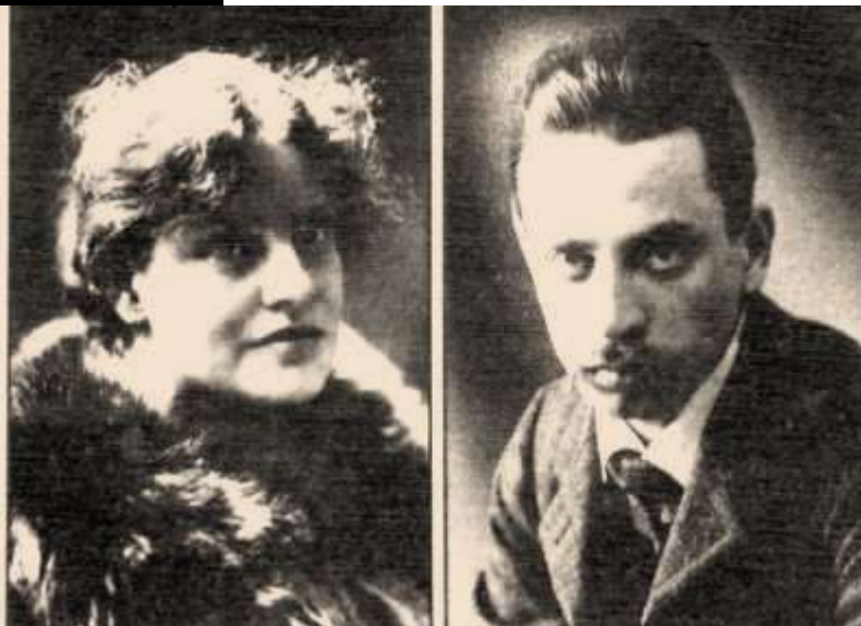
Lou Andreas Salomé e Rainer Maria Rilke