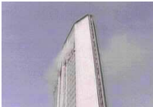
Milano, 18 aprile 2002 (PIRELLI)