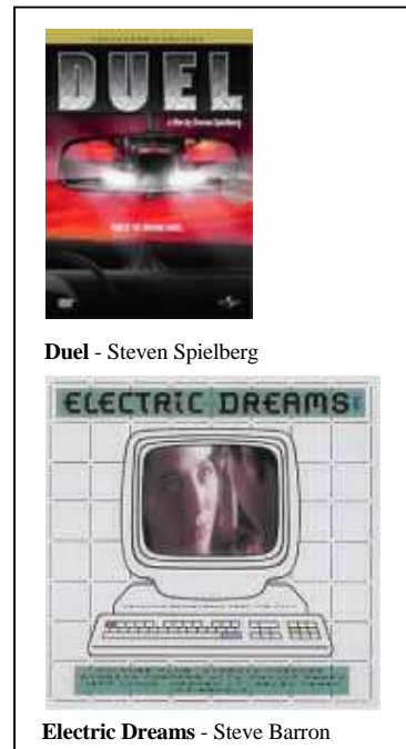
Duel - Steven Spielberg