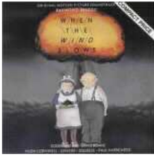
When the wind blows