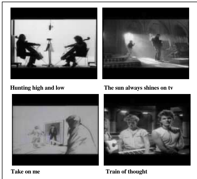
Hunting high and low

Il primo grande passaggio musicale l'ho avuto a 16 anni, attraverso un regista che mi ha legato a un percorso a senso unico, dove la struttura narrativa tipicamente cinematografica è riuscita a elevare lo stile qualitativo del prodotto commerciale rilegato alla canzone: Steve Barron . Avvicinatosi a lui grazie a un gruppo norvegese che ricalcava lo stile e l'originalità dei Beatles, gli A-ha, ogni video che si legava all'hit del momento era un proseguimento del precedente, nella forma, nella sua struggente soavità... nella freschezza che doveva trasmettere. Il primo lungometraggio che ha confermato la mia dedizione a questo stile inossidabile è stato Electric Dreams , che trova il suo alter ego nel primo lungometraggio di Spielberg, Duel ... capostipite del genio autodidatta adottato dagli states.