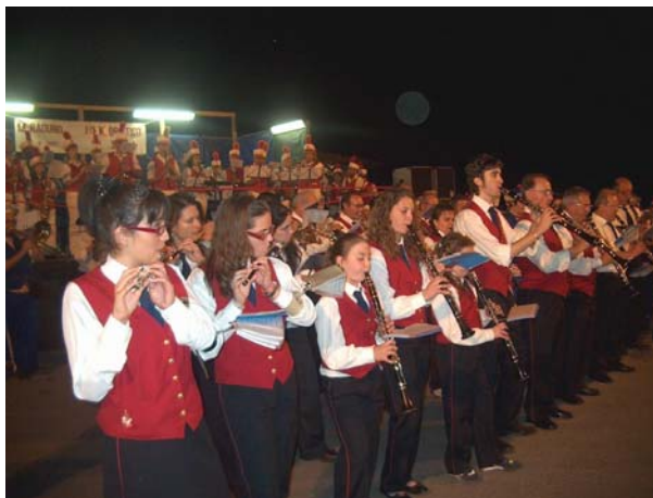
Il "concertone finale" al Raduno di San Miniato (PI)