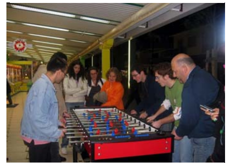
Ecco un momento della "titanica" sfida a biliardino