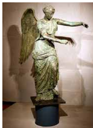
Vittoria Alata (MUSEO DI SANTA GIULIA BRESCIA) Si tratta di una figura femminile, volta leggermente verso sinistra; è vestita di una tunica fermata sulle spalle (kiton) e di un mantello (himation) che avvolge le gambe.