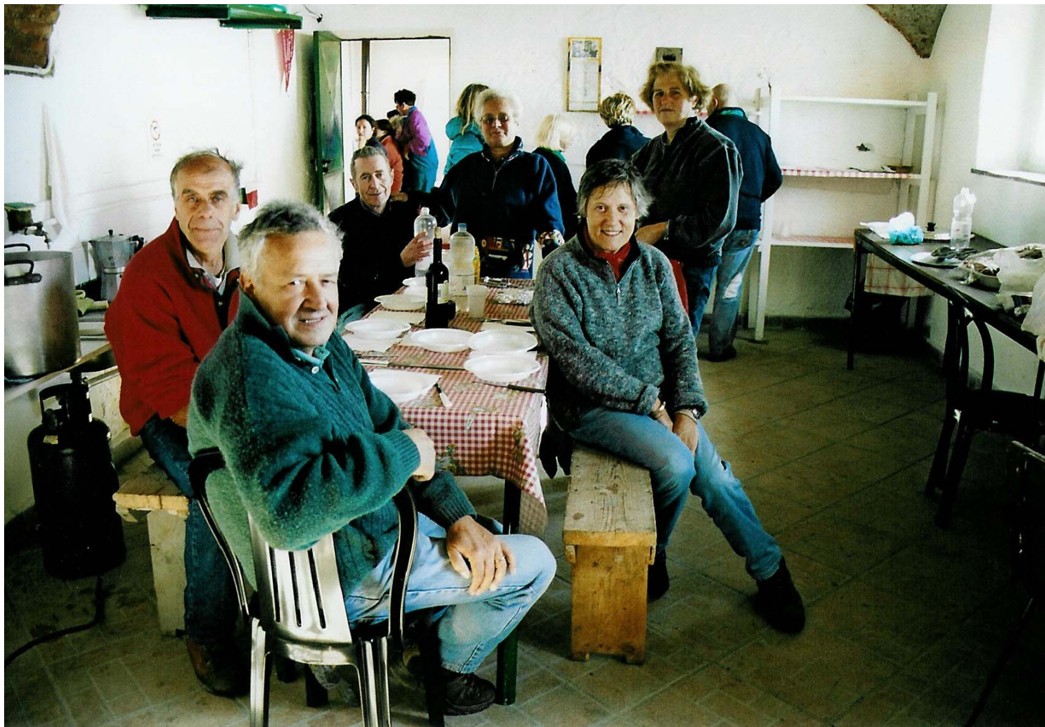
Gli "amici del Monte Reale", l'associazione che, con amorevole cura, gestisce la costruzione