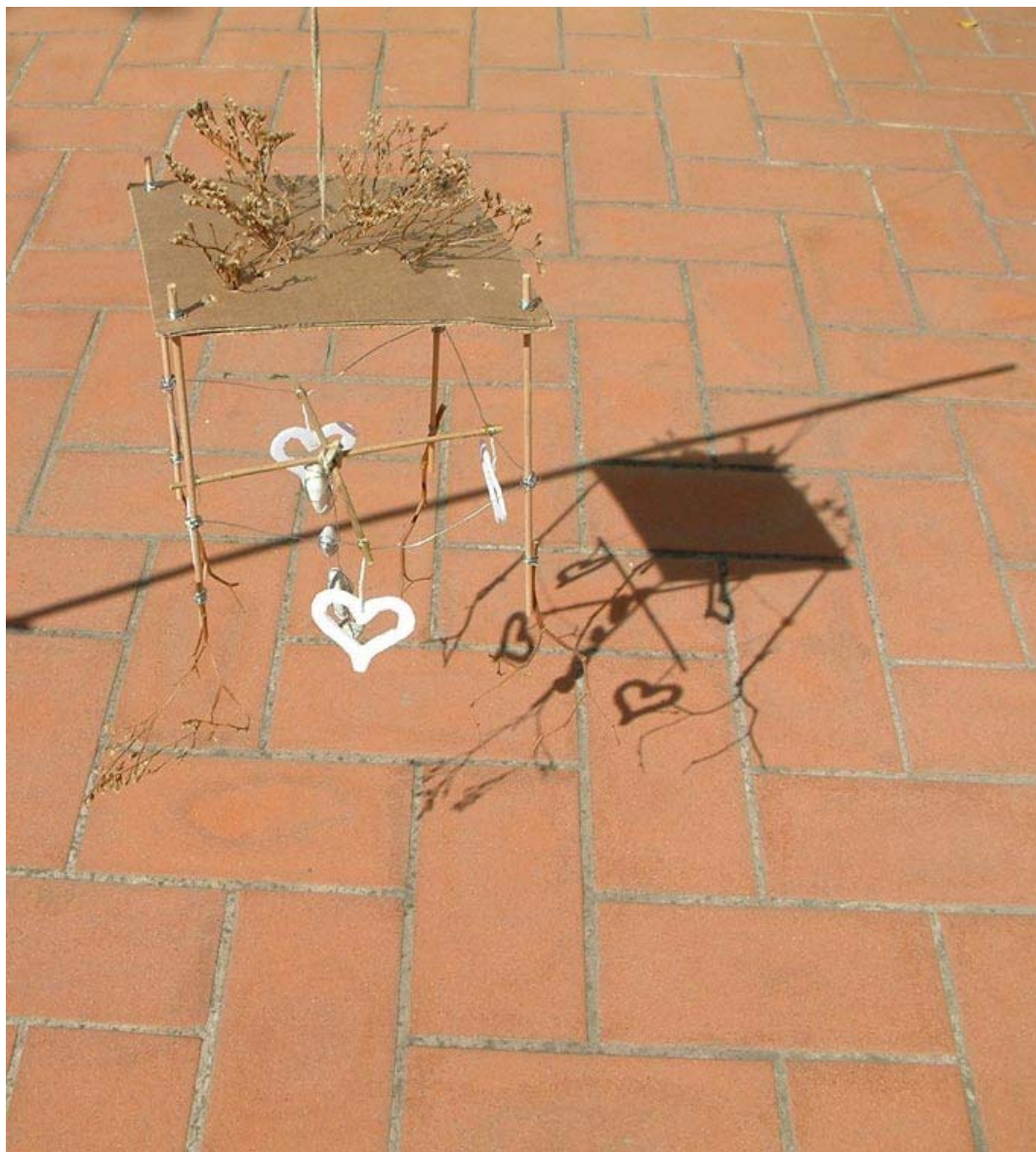
Foto3 - scacciapensieri "giardino sospeso", allieva: Giovanna