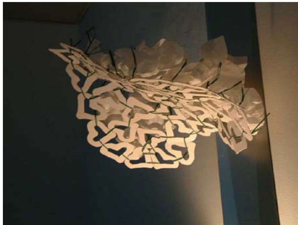
Foto 5-6 - lampada "lighthead" allievi :Valeria e Sandro, IV anno