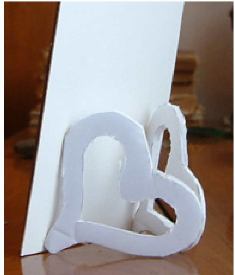
foto 10- lampada "c'era una volta", foto 11- portafoto "anamnesis" entrambi dell'allieva: Elisabetta, IV anno