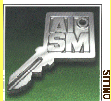
sezione provinciale di PN “Renata Arreghini”

“... La Giornata Nazionale dello Sport ci invita a recuperare i veri valori dello sport, troppo spesso soffocati dalla competizione esasperata tesa solo alla vittoria e all’annullamento dell’avversario. Vuole quindi essere una grande festa per ritrovare lo spirito del divertimento gareggiando con sano agonismo con i propri amici ...”