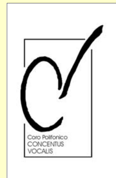
Coro Polifonico CONCENTUS VOCALIS