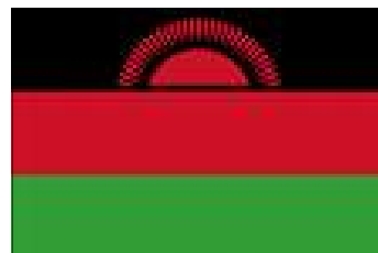
Bandiera della Repubblica del Malawi

Da diversi anni il Liceo “E. Majorana” di Spinaceto collabora con il Comune di Roma a progetti riguardanti la Memoria e la difesa dei diritti umani. Il progetto “Italia-Africa: una scuola per il Malawi” è finalizzato al coinvolgimento degli studenti in esperienze didattiche e formative rivolte alla conoscenza delle problematiche del sottosviluppo, alla riflessione sul problema della violazione dei diritti fondamentali dell’uomo e allo sviluppo di interventi di condivisione delle risorse e di solidarietà.