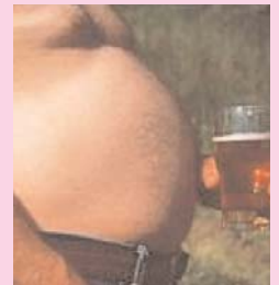
Il Mago Pancione