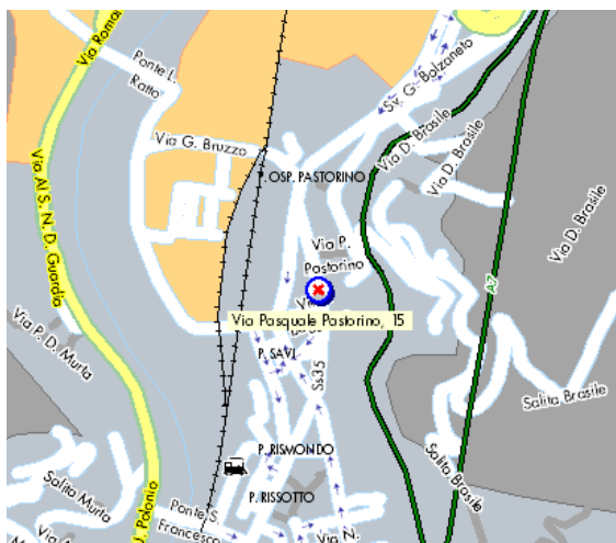
Siège de Bolzaneto qu'on peut atteindre par le train où les bus n. 7, 8, 63 et 270