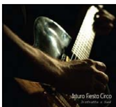
DISTRATTO A SUD ARTURO FIESTA CIRCO