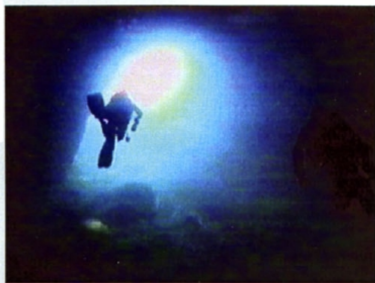
Grotta a Porto Selvaggio

Il nostro centro immersioni è attrezzato per programmare immersioni subacquee sia all'interno del Parco Marino di Porto Cesareo che in numerose altre località del Salento, note per la bellezza dei fondali.