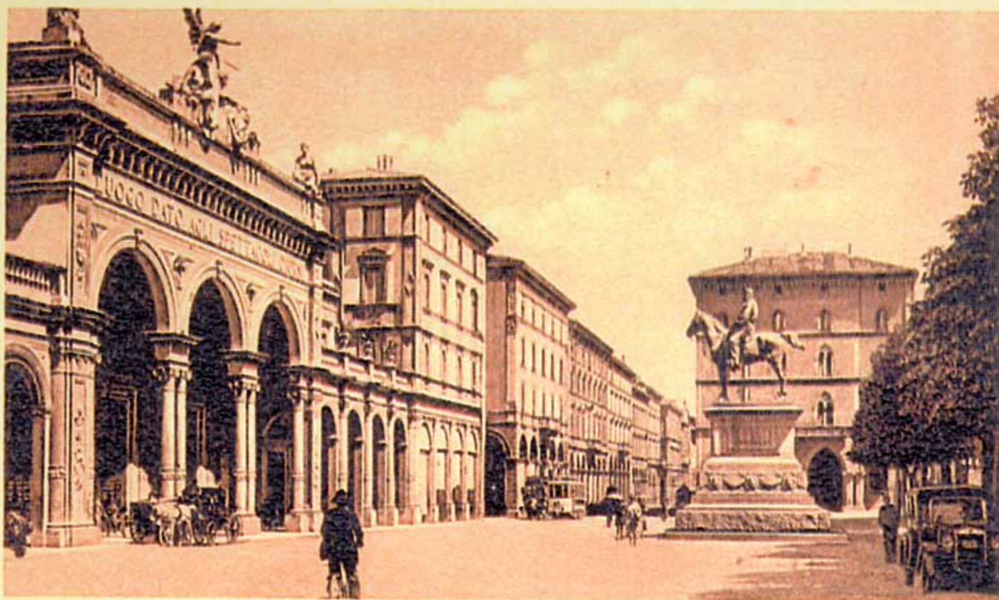
Bologna - Piazza e Monumento a Garibaldi