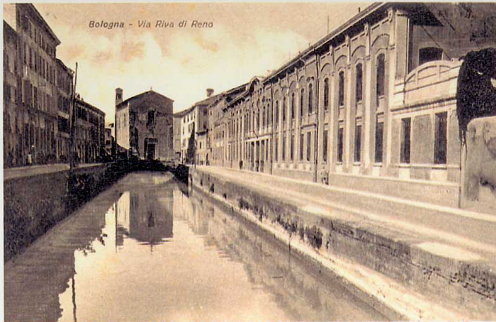
Bologna - Via Riva di Reno