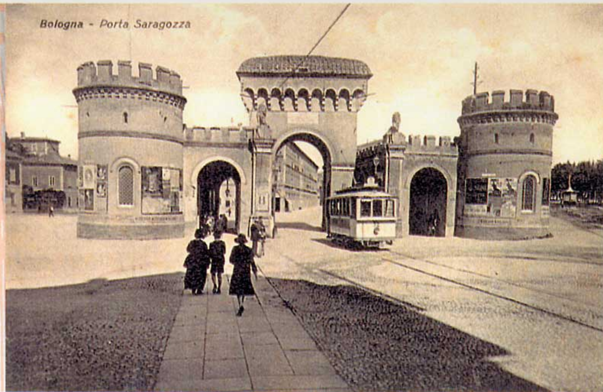
Bologna - Porta Saragozza

All'incrocio fra viale Antonio Aldini e viale Carlo Pepoli con via Saragozza. Guarda la piazza la torre dell'Istituto d'Ingegneria costruita nel 1935 da Giuseppe Vaccaro.