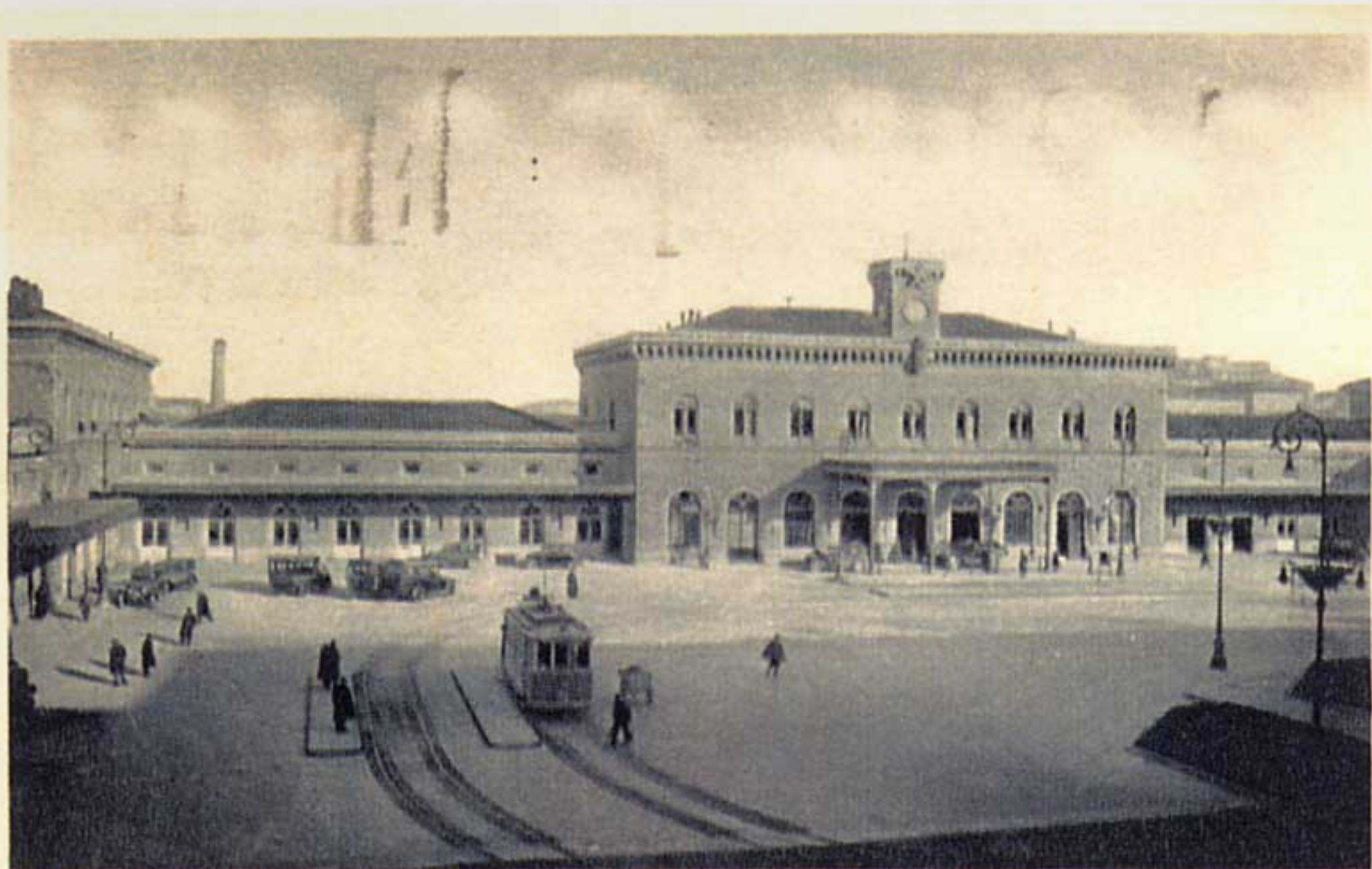
BOLOGNA - Stazione delle Ferrovie dello Stato