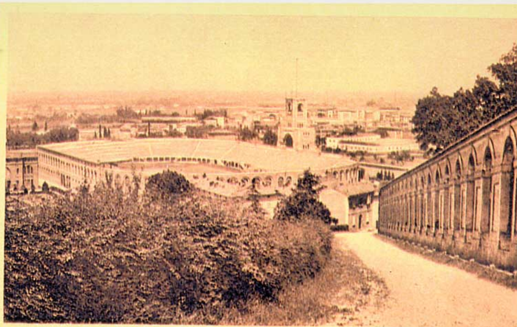
Bologna - Il Littoriale

Posto sotto il colle della Guardia, lo stadio di Bologna ha visto la luce nella zona che ospitava il Tiro a segno di Bologna nel lontano 1927. La Torre di Maratona è stata edificata solo due anni dopo. Ha cambiato tre volte il suo nome: "Littoriale" dalla nascita fino al 1945; "Comunale" fino al 1982; "Renato Dall'Ara", in onore al Presidente del Bologna calcio che più è legato ai colori rossoblu dal 1982 ad oggi. Nel 1988 ha subito un restauro che ha comportato la diminuzione della capienza ma con tutti posti a sedere. Nella sua lunga storia ha ospitato in due occasioni, 1934 e 1990 i campionati mondiali di calcio.