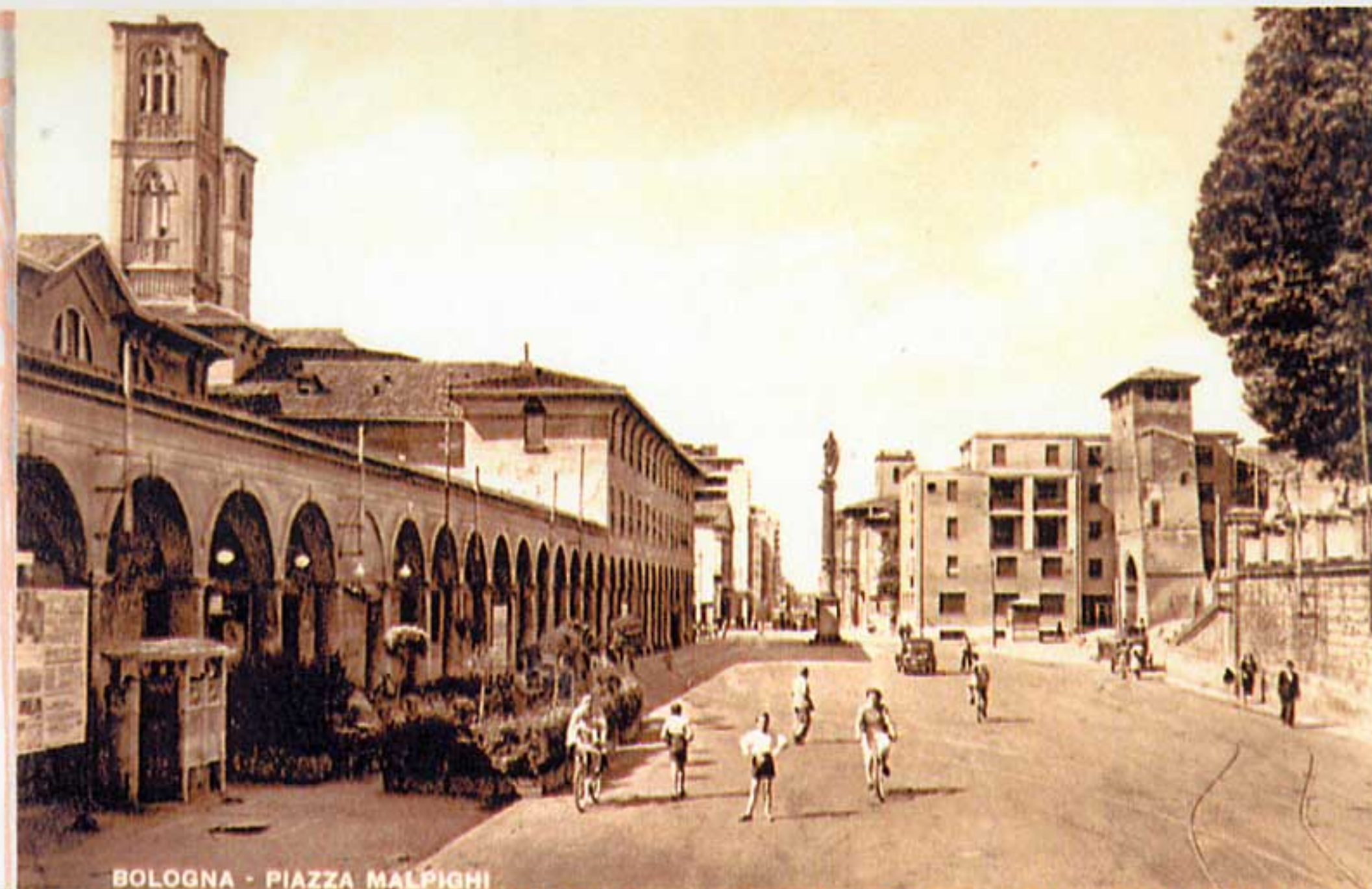
BOLOGNA - PIAZZA MALPIGHI

All'incrocio fra le vie Barberia, Sant'Isaia, e Nosadella. Il nome della piazza, deciso dopo la riforma toponomastica del 1874, onora il grande medico scienziato che a Bologna tenne cattedra, ricevendo onori dalle principali accademie scientifiche d'Europa.