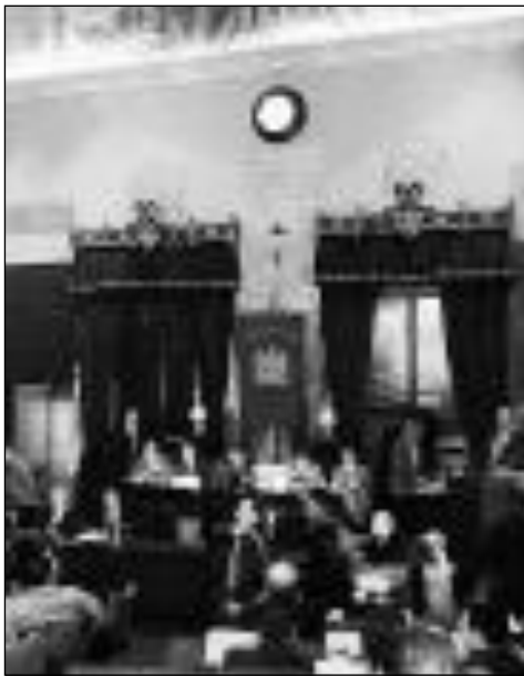
La Sala delle Lapidi ALLE PAGINE II e III