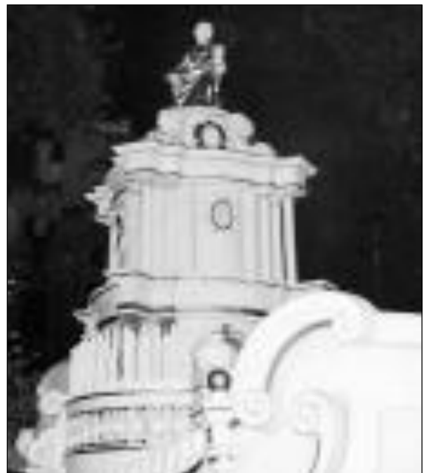
Il carro di Santa Rosalia

Meno folla degli anni passati per lo show sulla Santa La notte del Festino 150mila nelle strade