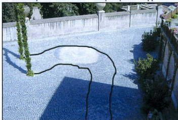
Simulazione del percorso della macchina del SS. Salvatore e posizionamento degli archi