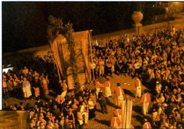
14 agosto 2008. Arrivo della processione

il Messaggero). Ma che le finanze del Comune di Tivoli fossero in floride condizioni era stato dimostrato già precedentemente quanto, a vasca quasi terminata al centro di Piazza Trento, il progetto fu cambiato ed il sito per