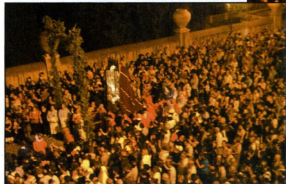
La macchina del SS. Salvatore posizionata in attesa dell'inchino

Come cittadino di Tivoli mi ritengo profondamente offeso per quanto supposto dal