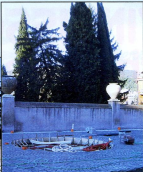
La vasca viene spostata nella posizione attuale

A fronte della campagna di disinformazione in atto sulla riqualificazione di piazza Trento, l'amministrazione comunale respinge con forza le strumentalizzazioni, anche di natura politica, che stanno riguardando la celebrazione del rito dell'Inchinata. Sulla collocazione del monumento a piazza Trento