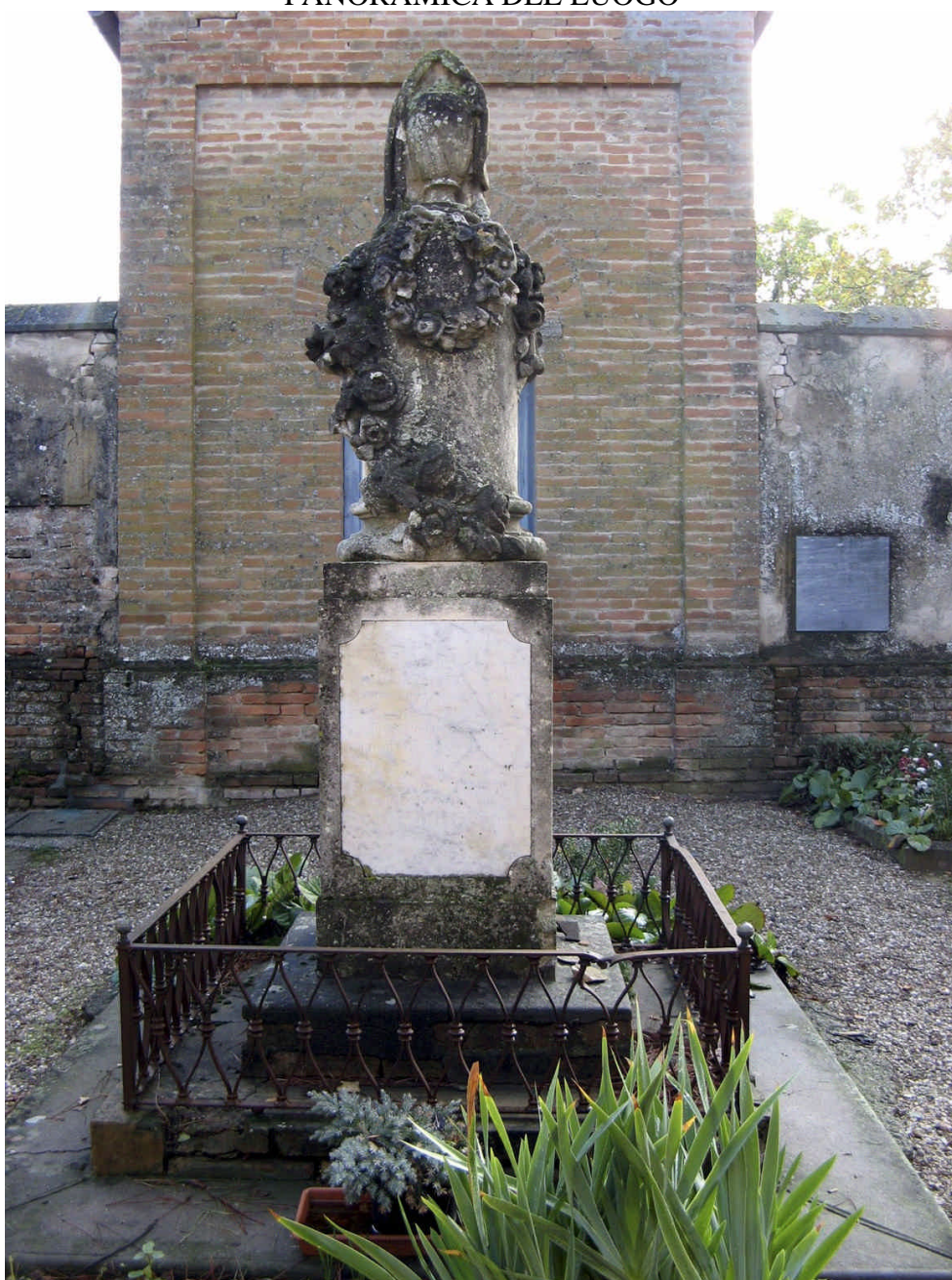
CIPPO DEI MARTUZZI NEL PICCOLO CIMITERO FORESE DEL FAENTINO