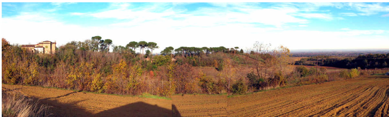
PANORAMICA DEL LUOGO