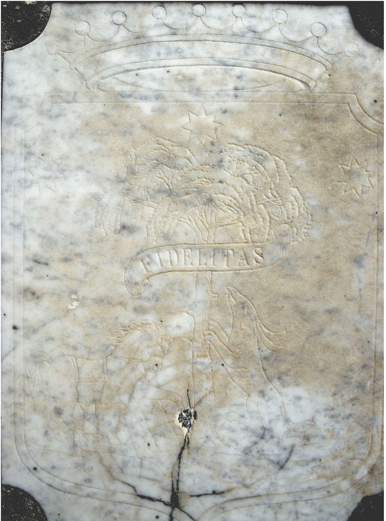
STEMMA NOBILIARE DEI MARTUZZI