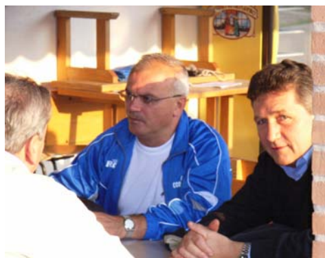
Domenica a Saugo è rimasto solo il calcio parlato

Eh sì, a Saugo rimane solo il calcio parlato. Il maltempo Domenica gli ha impedito di riscattare sul campo, l'opaca prova di Mercoledì in coppa,