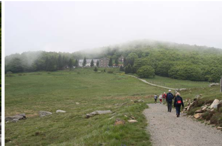
Piampaludo si raggiunge in auto o dal Passo del Faiallo (zona del Turchino) oppure da Varazze, risalendo fino all'Alpicella, Monte Beigua e Prato Rotondo.