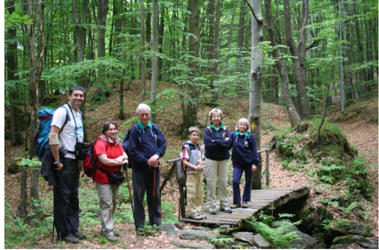
Lungo il bel sentiero + gialla, tra Piampaludo e l'Alta Via dei Monti Liguri, per boschi di faggio e rumorosi torrenti – 2h15m, EM