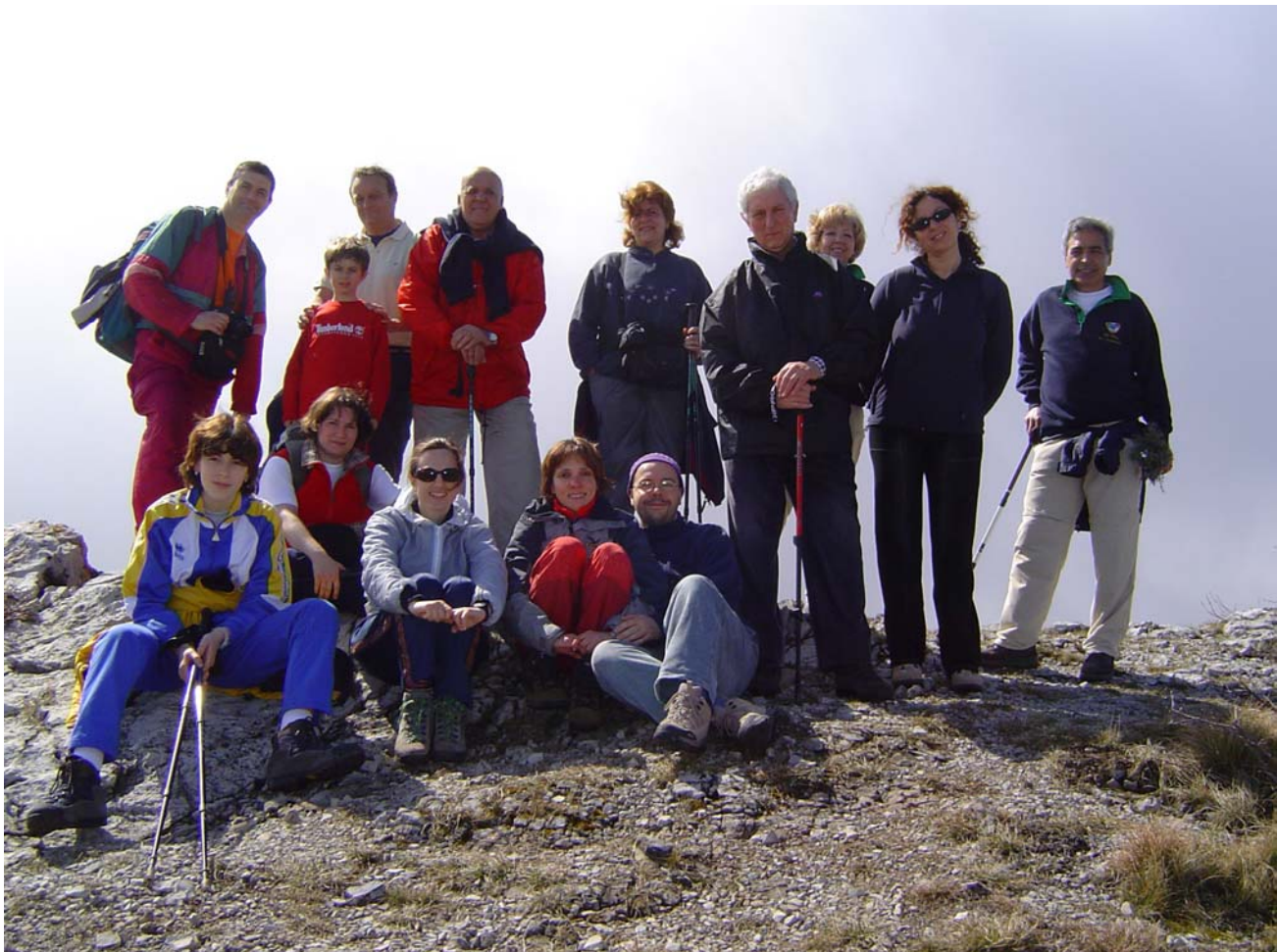
In vetta al Castellermo