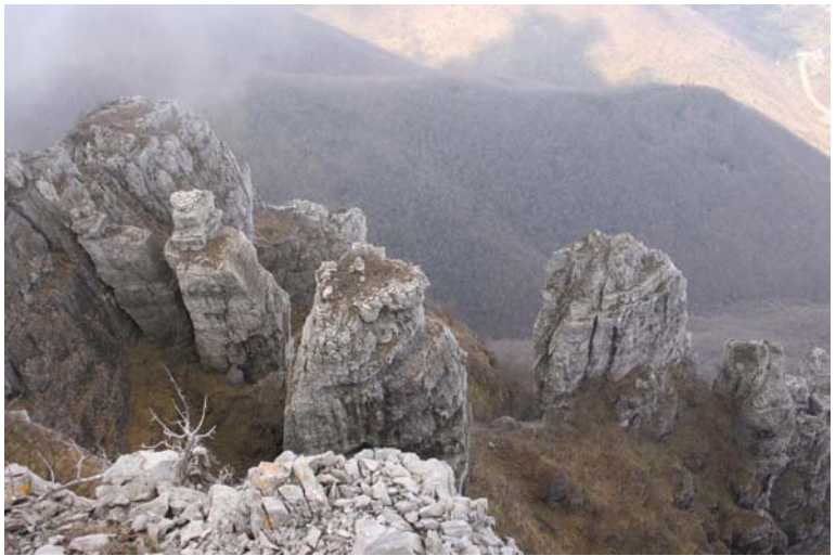
le guglie del Castellermo