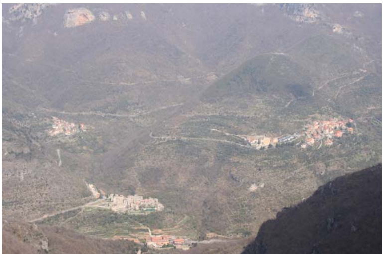
il "giardino" del monte Nero, visto dal belvedere