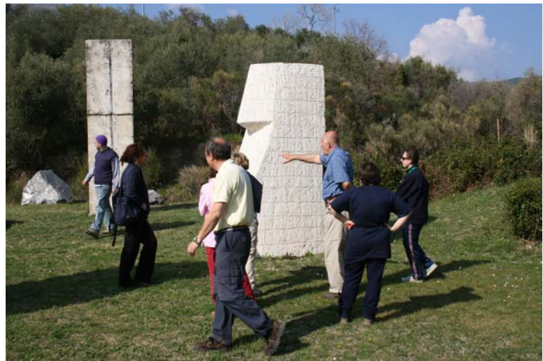
Il luogo delle Pietre nel parco ideato allo scultore tedesco Kreister (ed ora a lui dedicato) - presso la torre di Castellaro - pag. 3