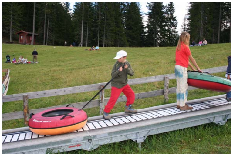
...e la più tranquilla pista dei gommoni dalla stazione a monte del Baranci