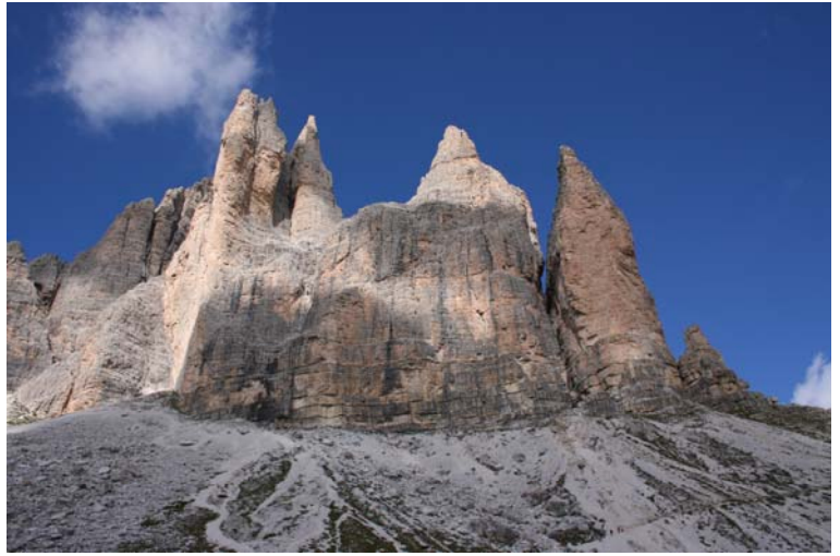
Le Tre Cime di Lavaredo ↓