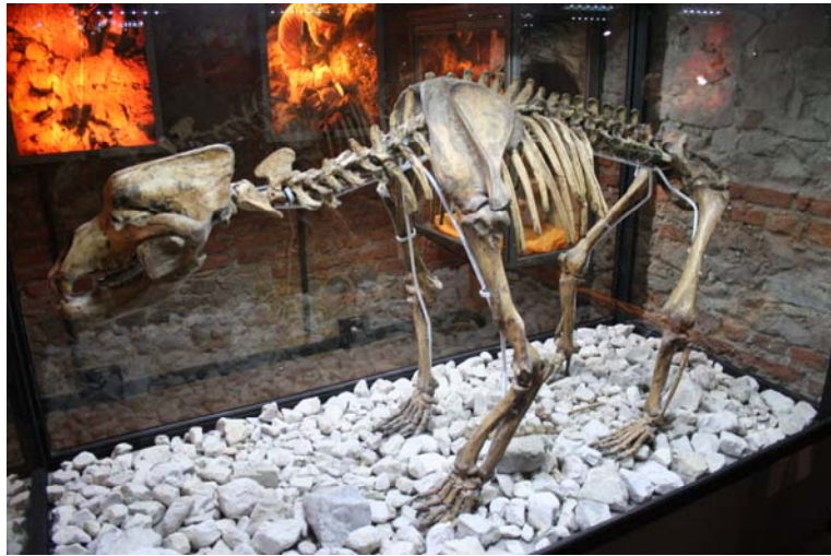
Interno del museo sui fossili Dolomythos a S. Candido