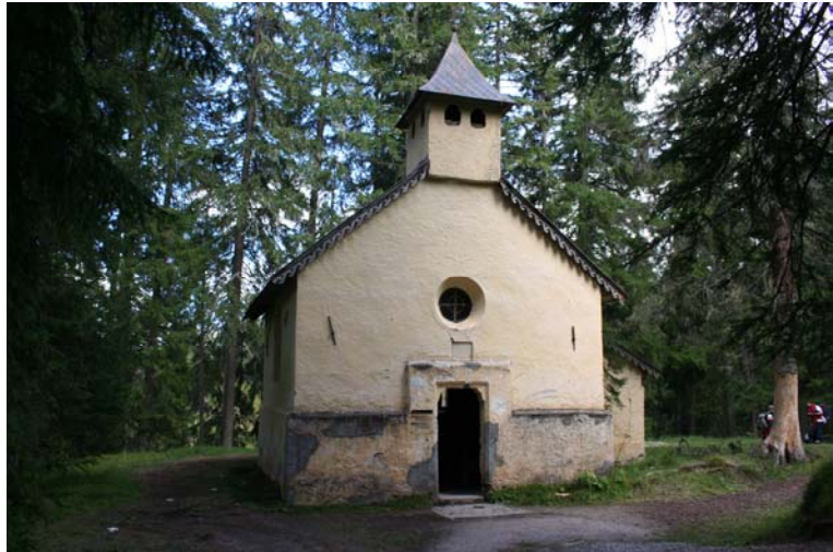
Chiesa S. Salvatore ai Bagni