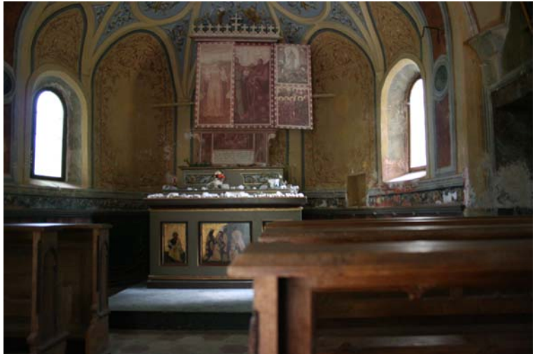
Interno della chiesa