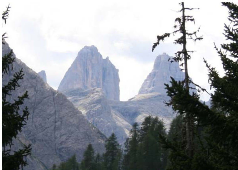
Le Tre Cime di Lavaredo dal sentiero 7A dal Baranci