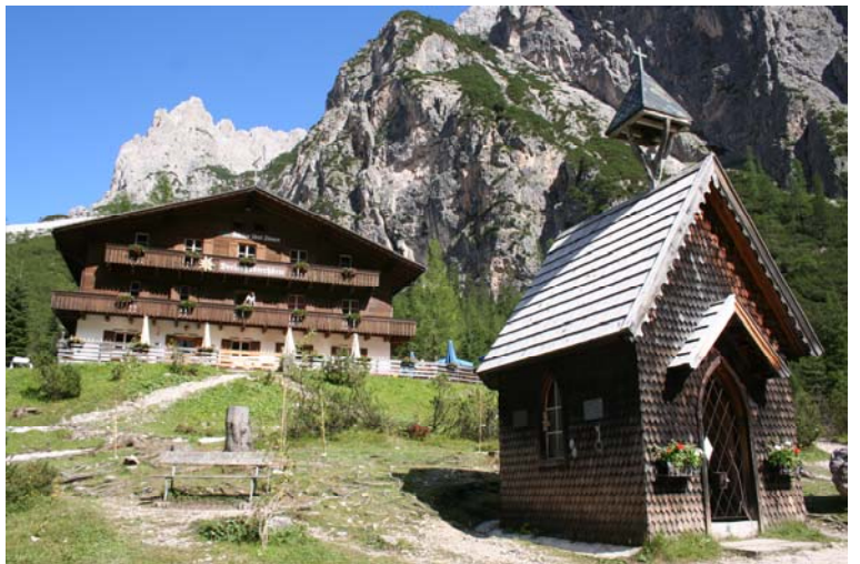
Rifugio Tre Scarperi