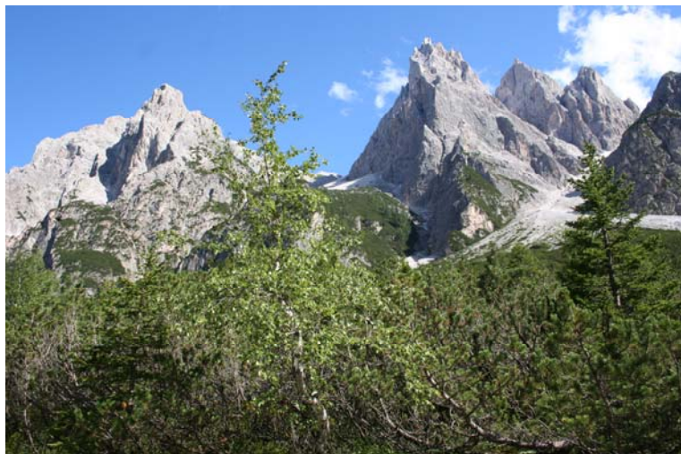
La cresta del monte Tre Scarperi