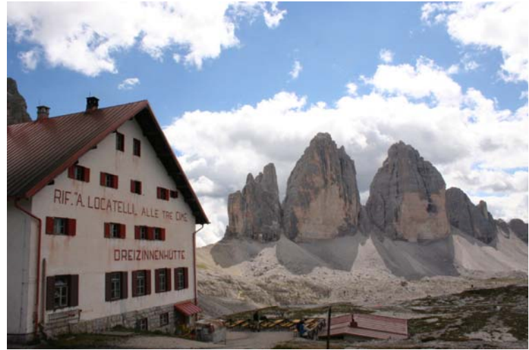
Il rifugio Locatelli