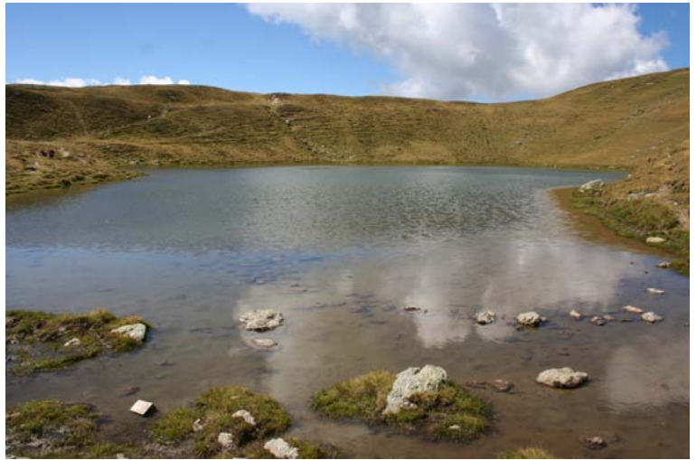
Thurntaler See 2332 m