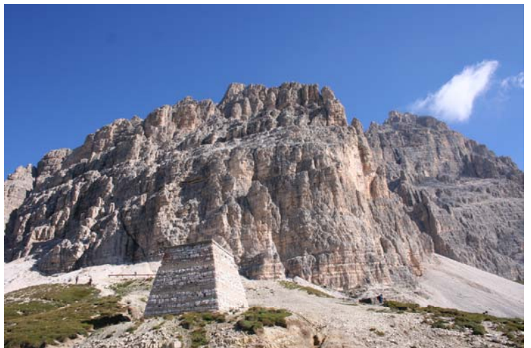
Presso il rifugio Auronzo