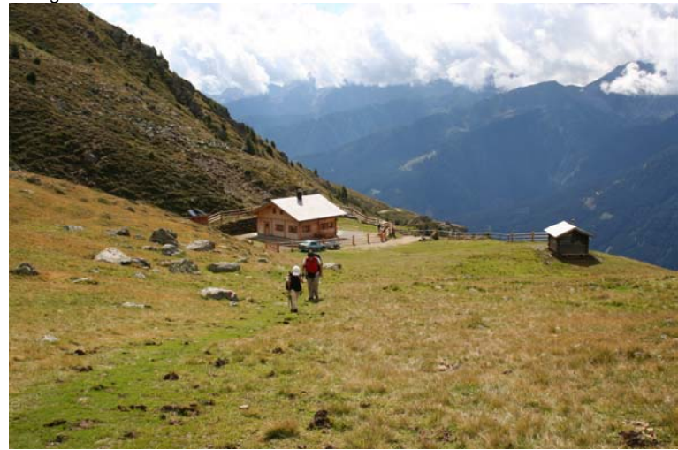
Verso il lago Thurntaler in Austria (Silian)