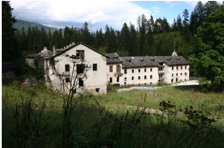
Hotel in rovina dai Bagni di S. Candido