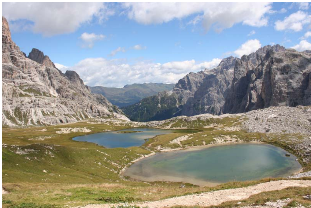
I laghi dei Piani