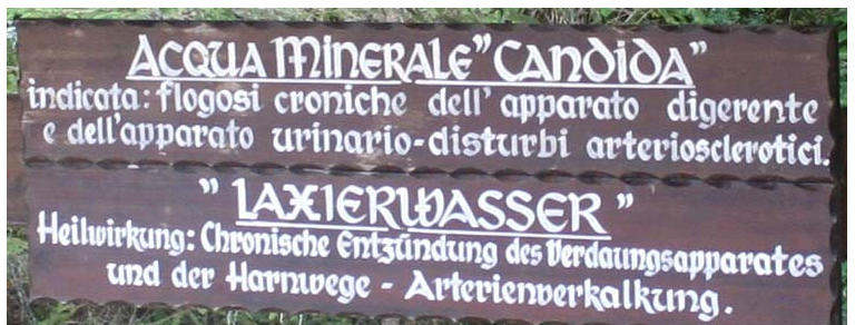
Le acque minerali