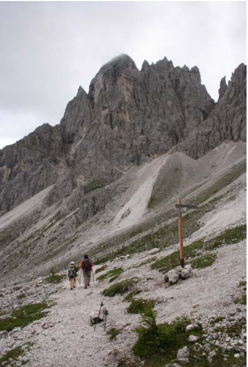
Sul sentiero 15A tra i prati della Croda Rossa ed il passo del monte Croce Comelico