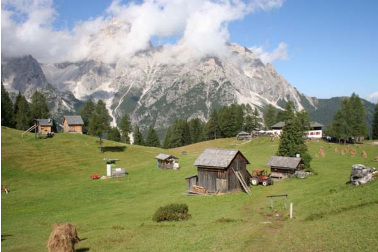
I prati della Croda Rossa