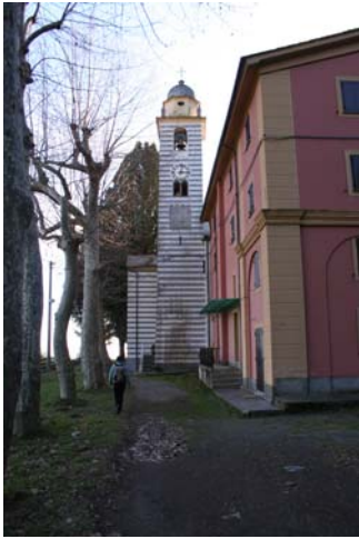
Madonna di Reggio (90 minuti da Soviore)