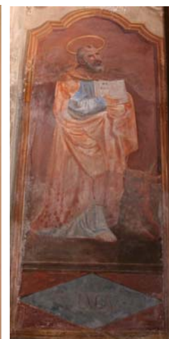
Interno della chiesa