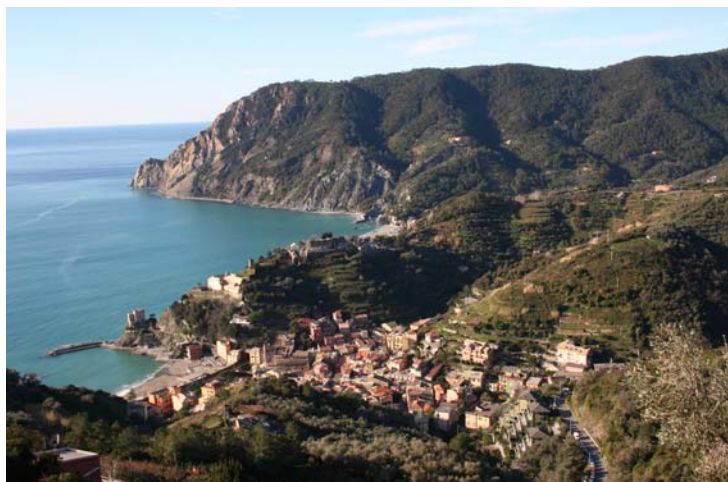
Monterosso dall'alto (si prende il sentiero n. 9 da via Roma)