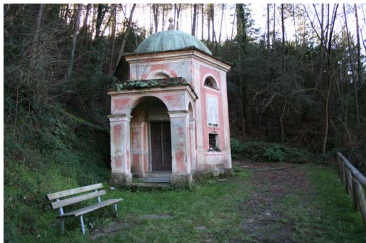
in circa 90 minuti si arriva da S. Soviore (1^ tempietto)