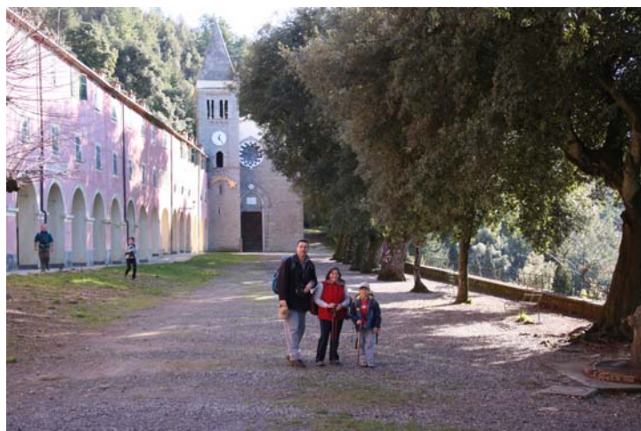
Il Santuario di Madonna di Soviore