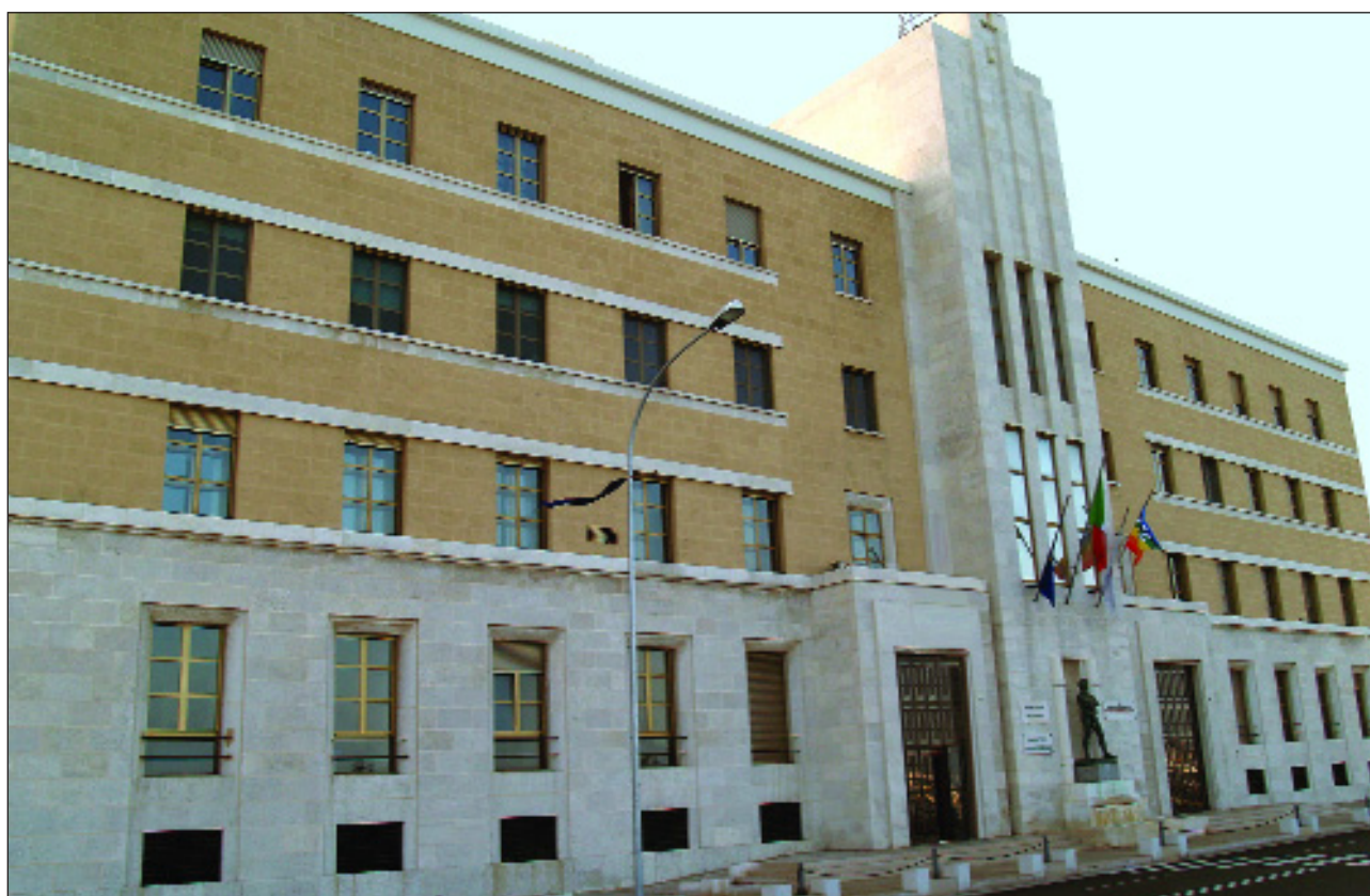
Sede Presidenza Giunta Regionale