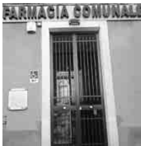
LA FARMACIA AL PIANTERRENO DEL MUNICIPIO

Valverde. Oggi inaugurazione, nel pianterreno del Municipio, della prima struttura a gestione totalmente pubblica