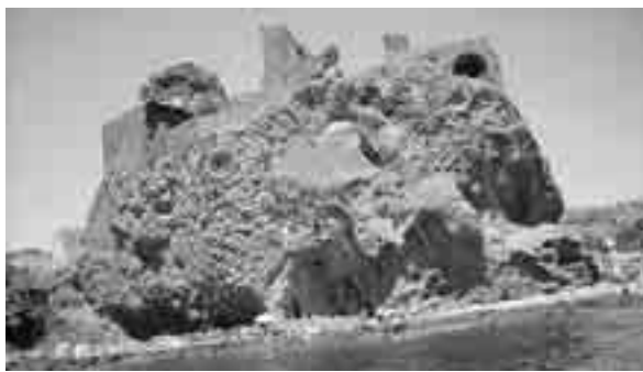
BAGNANTI SULLA SPIAGGIA SOTTO IL CASTELLO

Già alle 7 del mattino di ieri i primi occasionali passanti ai piedi del Castello non hanno resistito all'invito del mare, simile a uno specchio limpido (grazie alle attuali correnti favorevoli) e, scesi dalla piazza, non ci hanno pensato due volte a tuffarsi (in mutande o in costume). E' stato subito pienone nel mare fra il Castello e i Faraglioni, nonostante la temperatura dell'acqua in questo momento smorzi non poco i «bollenti spiriti»: è stato come l'avvio ufficiale della stagione estiva grazie ai 30 e passa gradi di temperatura ester-